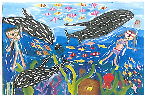
草湖國小 五年忠班 陳詩婷