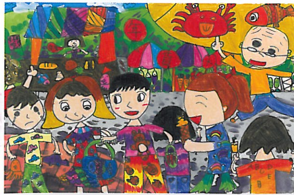
湖北國小 二年四班 巫箐綺