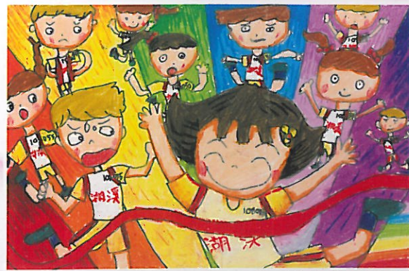
溪湖國小 二年乙班 林上鳳