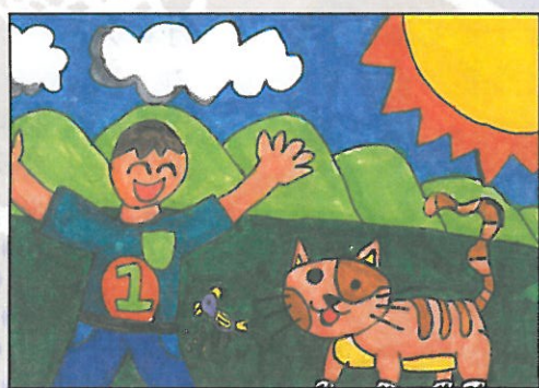
彰化縣 大嘉國小 四年甲班 孫梓博