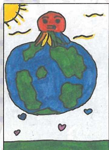
彰化縣 大榮國小 六年乙班 羅安安