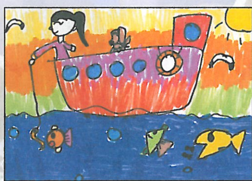
金門縣 中正國小 二年 6 班 陳婉麗