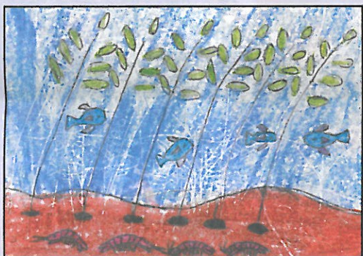
臺南市 小新國小 五年甲班 毛雨濛