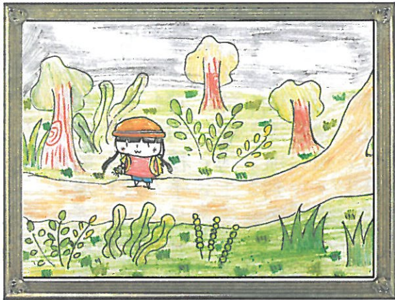
彰化縣 忠孝國小 六年 2 班 徐淨語