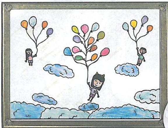
彰化縣 忠孝國小 五年 8 班 陳昱喬