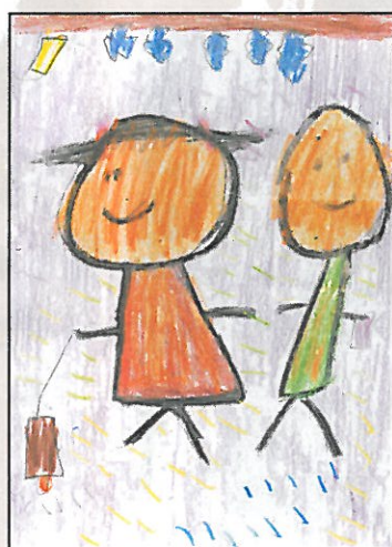
臺中市 鎮平國小 二年 5 班 江品宏

第 16 版答案： 是非題 ↓ 1. ○ 2. × 3. ○ 4. ○ 5. × 6. ○ 7. ○ 8. × 哪裡不同？↓ 如圖所示