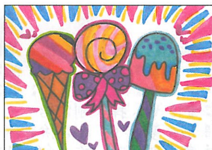
桃園市 平興國小 四年 5 班 顏恩祈