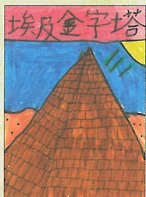
臺南市 小新國小 三年甲班 毛宸琪

第 13 版答案： 1. sale、son 2. sun、pair 第 32 版答案： 牛的俗語→ 1. E 2. B 3. D 4. A 5. C 文字樓梯→ 如圖所示