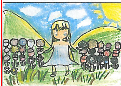
彰化縣 大榮國小 六年甲班 陳育如