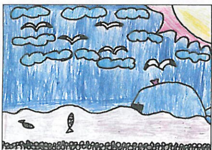
彰化縣 大嘉國小 三年甲班 周祐熏