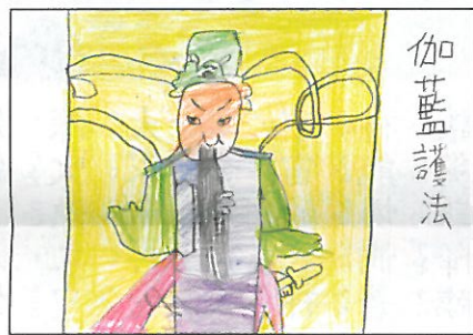
臺中市 建功國小 五年 2 班 張丞廷