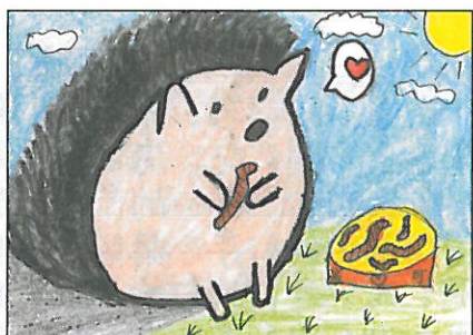
新竹縣 關西國小 五年甲班 羅采晴