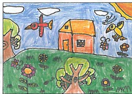
彰化縣 大嘉國小 五年乙班 蔡博宇