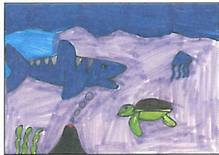
彰化縣 大榮國小 六年乙班 何紹宸