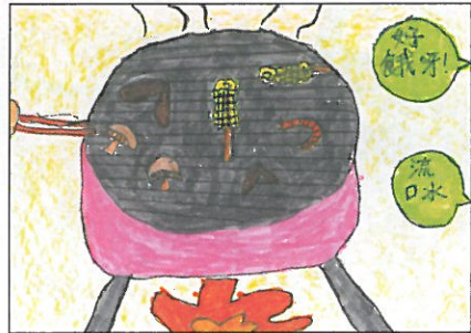
臺南市 小新國小 五年甲班 毛雨濠