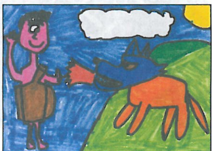
彰化縣 大榮國小 六年甲班 趙冠穎