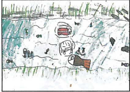
新竹市 三民國小 二年 2 班 許妍婷