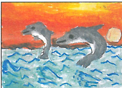
臺南市 崇明國小 三年 2 班 呂孟翰