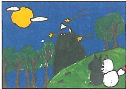
彰化縣 大榮國小 六年乙班 施懿嫻