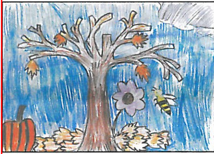
臺中市 大甲國小 五年丙班 閻紘逸