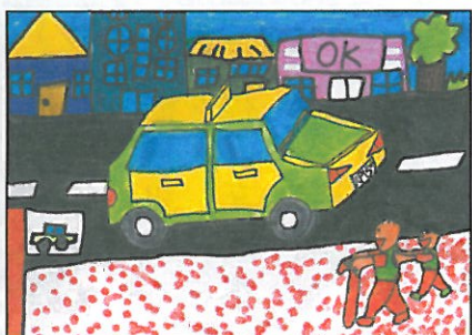
彰化縣 大嘉國小 四年甲班 孫梓博