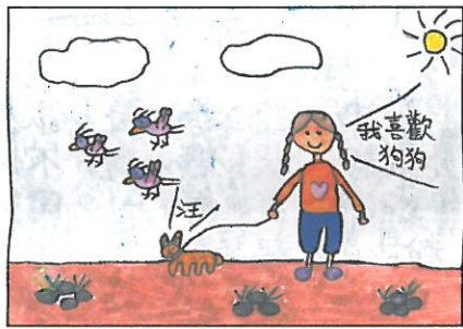
臺南市 小新國小 五年甲班 毛雨濠