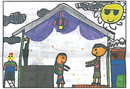
彰化縣 大嘉國小 四年甲班 阮芊滄