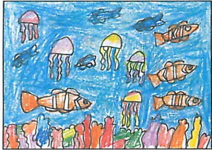
臺中市 霧峰國小 一年 4 班 盧佩綺