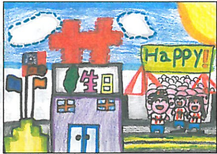
彰化縣 大嘉國小 四年甲班 黃沛綺