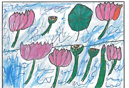
嘉義縣 興中國小 三年 1 班 李映萱