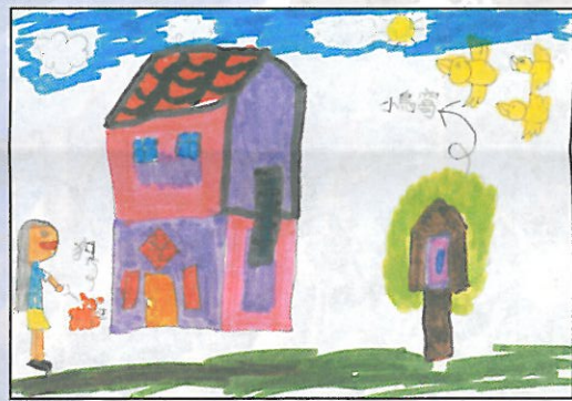
彰化縣 培英國小 三年甲班 柯子瑜