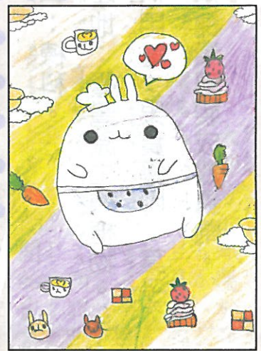
彰化縣 大嘉國小 五年甲班 劉詩琦