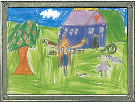
臺南市 協進國小 三年4班 柯明杰