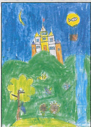
臺南市 小新國小 二年甲班 毛宸鍇