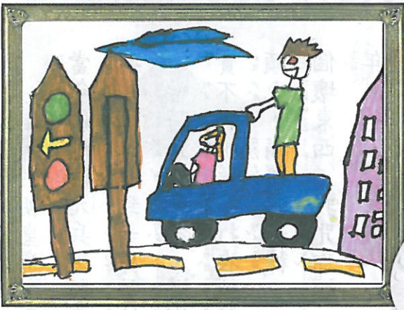
基隆市 安樂國小 四年2班 陳羨琳

2001期的題目獲得熱烈的迴響，現在就來公布入選作品囉！想投稿本期題目，要畫在明信片背後（畫橫式），註明：縣市、學校、班級和姓名，並在3月30日前寄給「亞特哥哥 圖畫接龍」收哦！