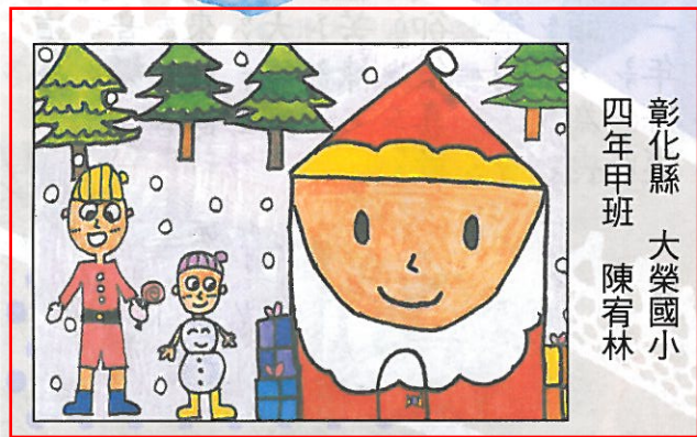
彰化縣 大榮國小 四年甲班 陳宥林