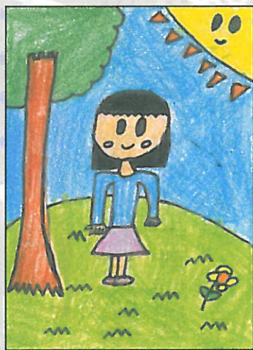
新竹縣 新星國小 二年乙班 張維真