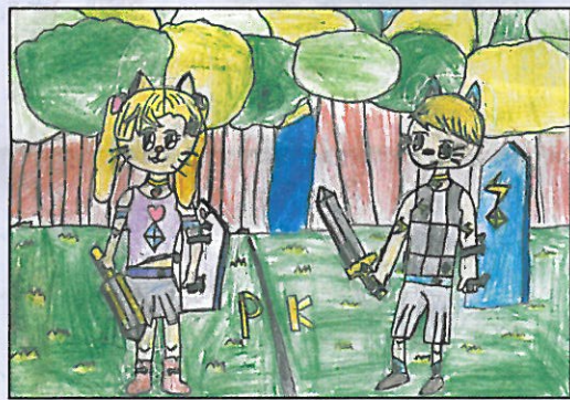
新北市 八里國小 四年3班 江翊濤