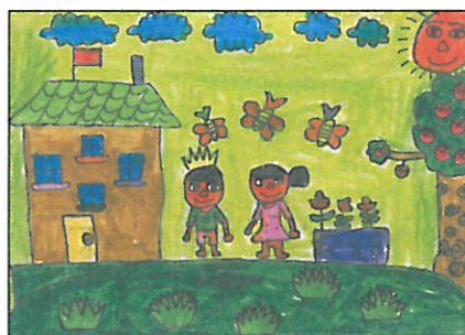
彰化縣 大榮國小 二年甲班 洪霆恩