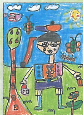
新竹縣 新星國小 二年乙班 黃采晴