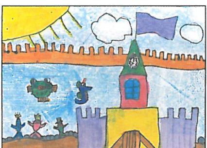
臺南市 小新國小 二年甲班 毛宸琪