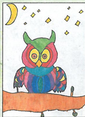
臺中市 大忠國小 四年乙班 陳菁郁