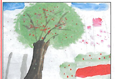
彰化縣 大嘉國小 四年乙班 鄭羽心