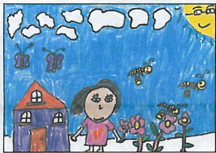
新竹縣 新星國小 四年甲班 張玆萱