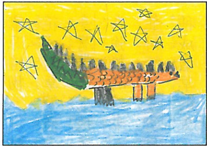
嘉義縣 東榮國小 一年乙班 林叡玆