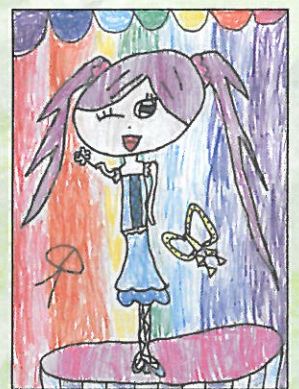
臺南市 海東國小 三年9班 黃筠喬