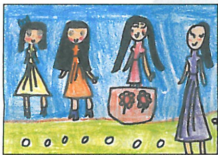
彰化縣 大嘉國小 一年甲班 阮雅芳