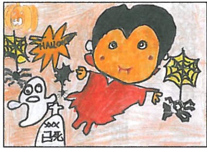
彰化縣 大榮國小 四年甲班 謝昊軒