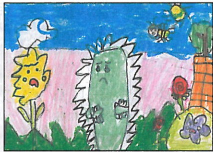
彰化縣 大嘉國小 四年甲班 許 玆