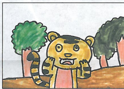
臺中市 立達國小 四年6班 金麗珠