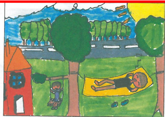
彰化縣 大榮國小 五年甲班 黃詩函