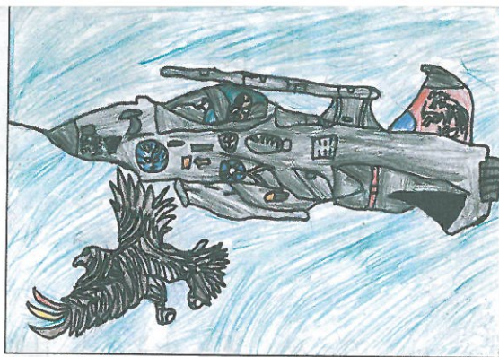
嘉義市 港坪國小 四年1班 謝松澄