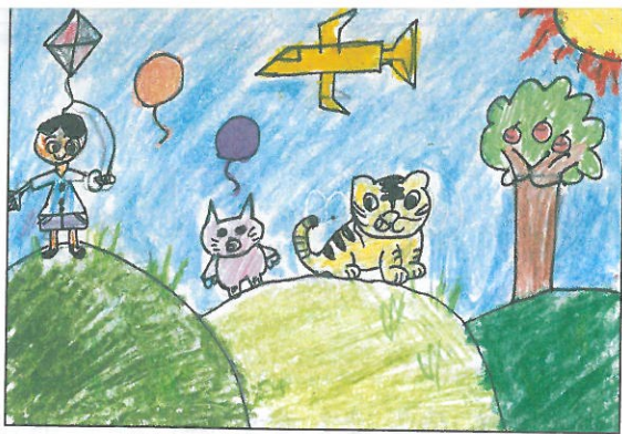
彰化縣 湖北國小 四年4班 楊智宣