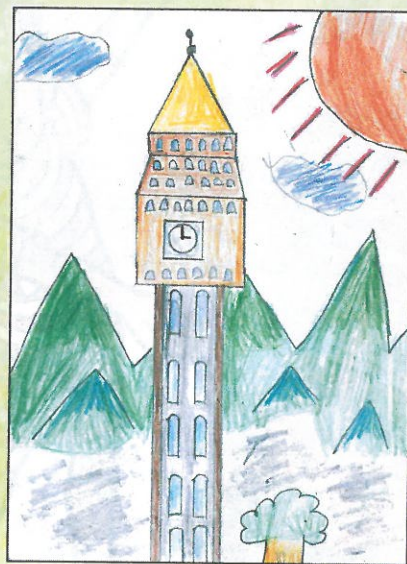
彰化縣 員林國小 五年8班 黃柏睿