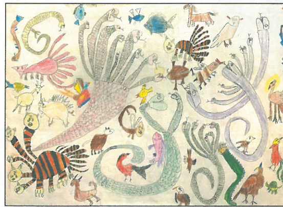
臺中市 北勢國小 四年11班 張杞薰