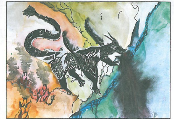
臺中市 梧南國小 四年甲班 陳東毓