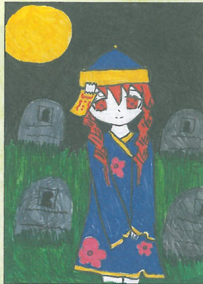
臺南市 新泰國小 五年4班 陳芝德