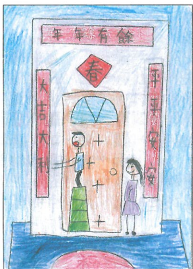
臺南市 小新國小 六年甲班 毛雨濛