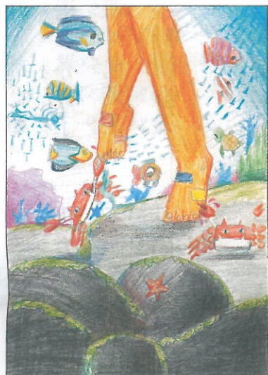
臺中市 省三國小 五年 2 班 李原治