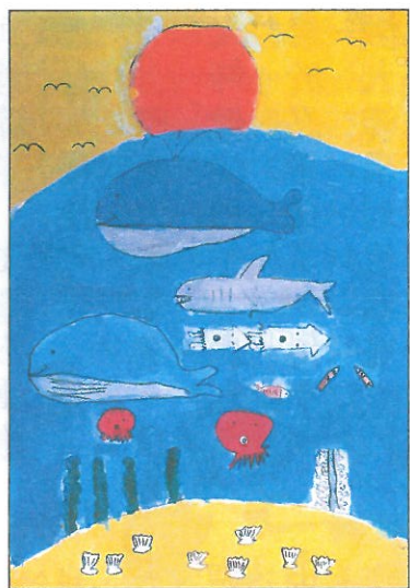
彰化縣 大同國小 五年甲班 林庚其