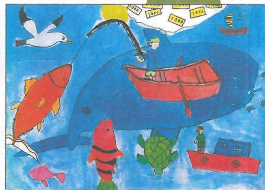
彰化縣 大同國小 五年甲班 陳彥瑞