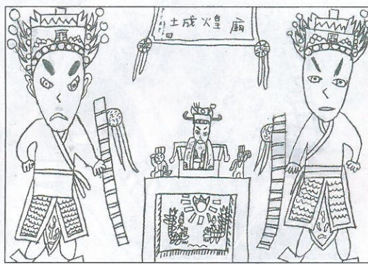
高雄市 林園國小 四年 5 班 房彥璋