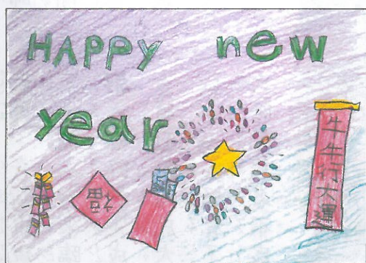
臺南市 復興國小 四年 4 班 李沅真